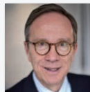
Matthias Wissmann Präsident des VDA e.V.